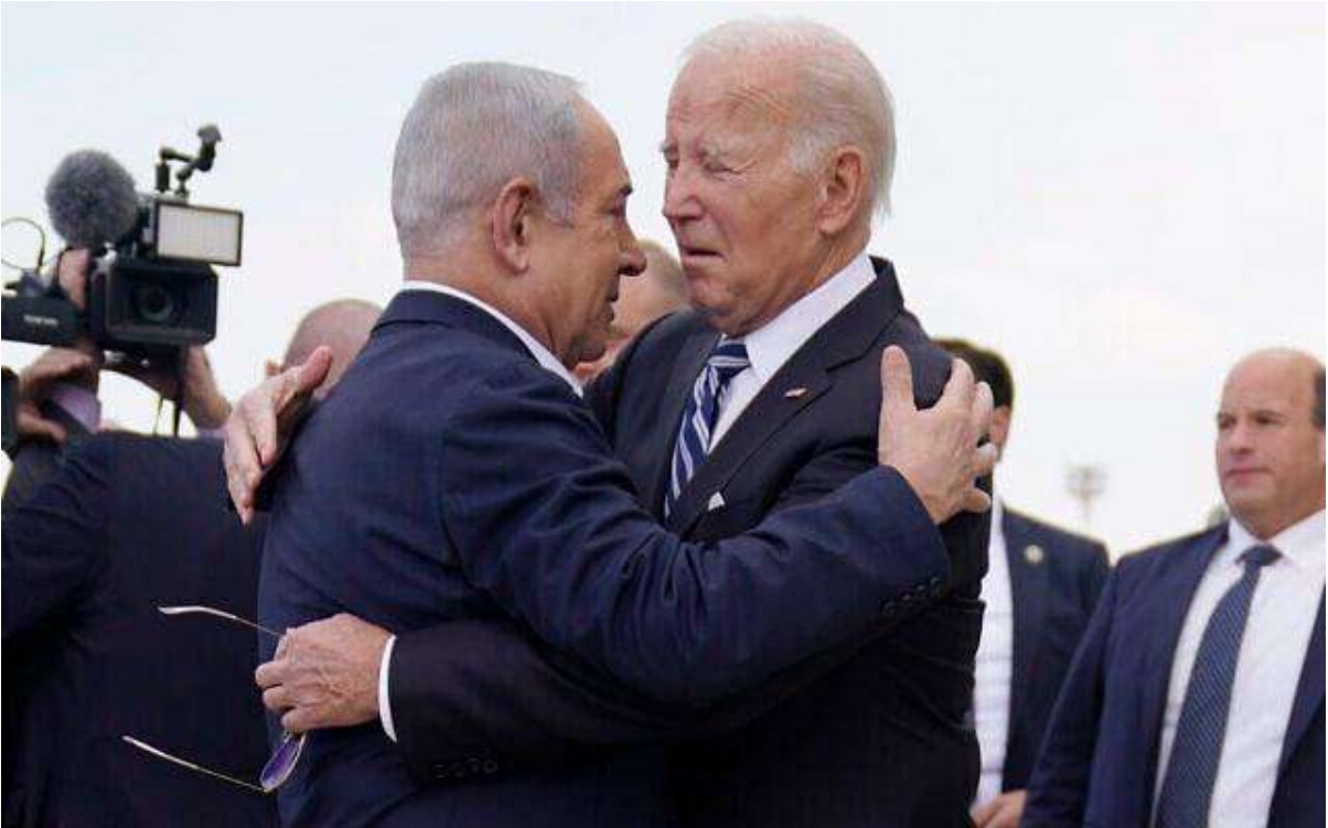
El presidente de Estados Unidos, Joe Biden, es recibido por el primer ministro, Benjamin Netanyahu, después de llegar al Aeropuerto Internacional Ben Gurion, el 18 de octubre de 2023, en Tel Aviv.

Al comienzo de la guerra en Gaza, el primer ministro Benjamin Netanyahu preguntó al presidente estadounidense Joe Biden si podía presionar a Egipto para que aceptara a parte de la población de la Franja en su territorio mientras durara el conflicto, informó el jueves The Washington Post .