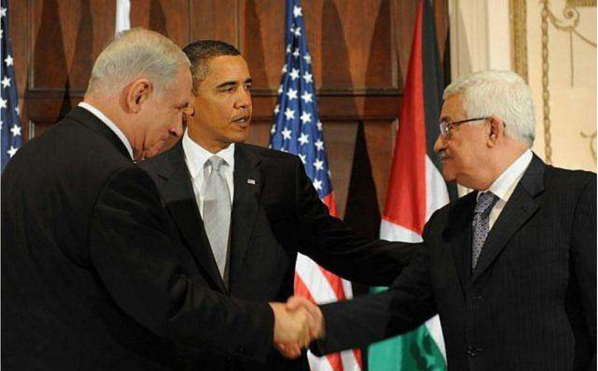
ARCHIVO – De izquierda a derecha: el primer ministro Benjamin Netanyahu, el presidente estadounidense Barack Obama y el presidente de la Autoridad Palestina Mahmoud Abbas durante una reunión trilateral en Nueva York, el 22 de septiembre de 2009.

Sin embargo, el veterano diplomático estadounidense dijo que Netanyahu “rechaza esta idea de plano, porque sus socios de coalición tienen la intención de deshacerse de la Autoridad Palestina”. Quieren anexionar Cisjordania en lugar de que sea gobernada allí por la Autoridad Palestina, por lo que no quieren que resucite a través de un nuevo papel en el gobierno de Gaza”.