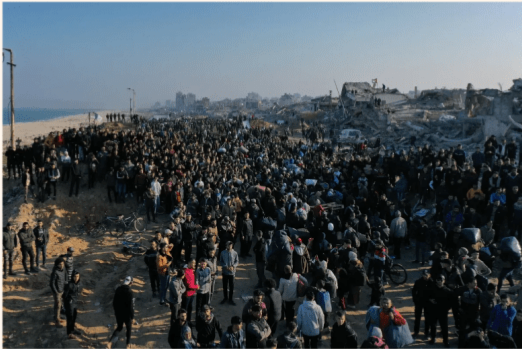
Tens of thousands of Palestinians, displaced by Israel forces, return their houses through Al-Rashid Street on the coastal strip following the ceasefire agreement in Gaza City, Gaza on January 27, 2025.

¿Están justificadas las preocupaciones de los egipcios sobre un posible plan respaldado por Trump para trasladar palestinos de Gaza a Egipto , particularmente en el Sinaí, tras la guerra genocida de Israel en Gaza?