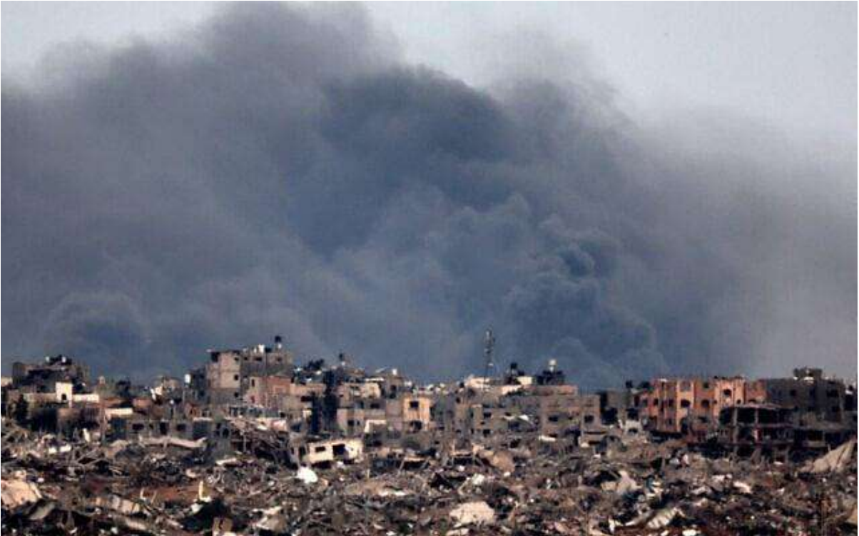
Una imagen tomada en el sur de Israel, cerca de la frontera con la Franja de Gaza, el 21 de diciembre de 2023, muestra humo saliendo de los ataques aéreos de las FDI.

La guerra estalló entre Israel y Hamás después de la masacre del 7 de octubre, en la que unos 3.000 terroristas cruzaron la frontera desde la Franja de Gaza por tierra, aire y mar, matando a unas 1.200 personas y tomando más de 240 rehenes de todas las edades, al amparo de una avalancha de miles de cohetes disparados contra ciudades y pueblos israelíes.